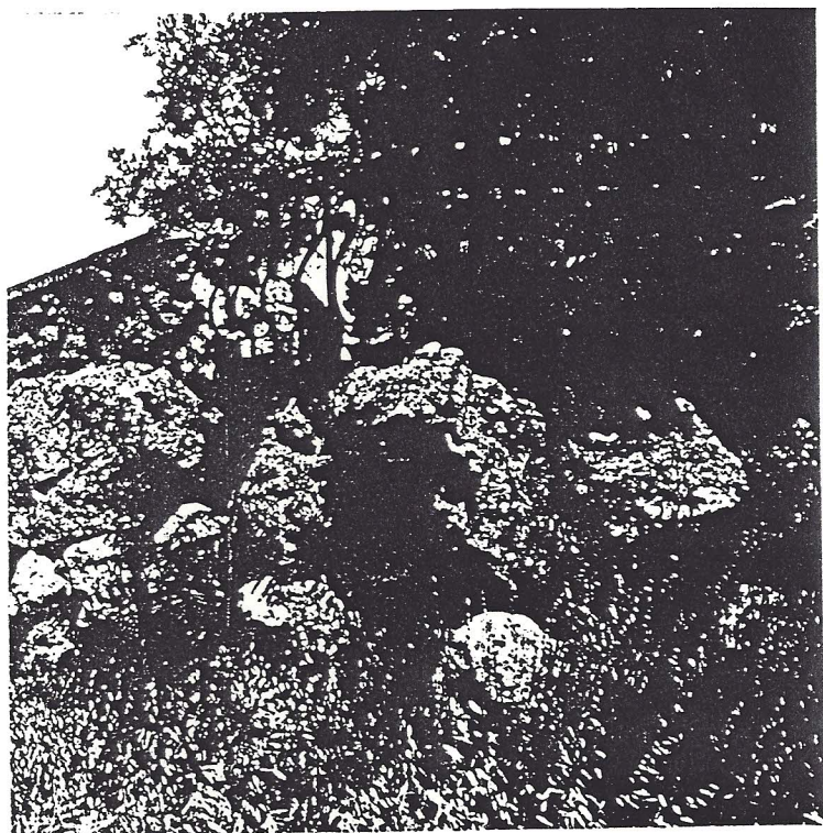
Artistico balconcino spanciato in ferro battuto sul ciclopico muro di recinzione della villa del Monte.

un'eccezionale realtà botanica, era ricco di più di cento specie arboree.